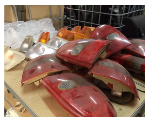
Die Vielfältigkeit der Produkte ist groß