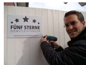
Im Januar 2014 nahm „FSD“ die Geschäftsaktivitäten auf