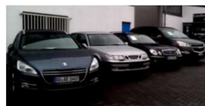
Eine der Säulen von FSD: Der PKW-Verkauf