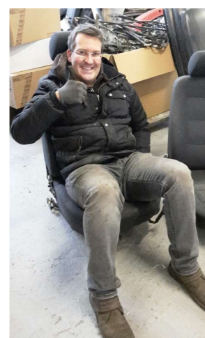
Auf die nächsten 5 Jahre bei FSD!