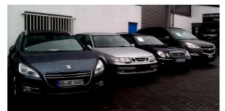
Eine der Säulen von FSD: Der PKW-Verkauf