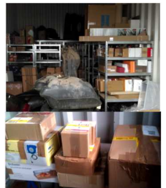
Die Lager- und Logistik-prozesse werden ständig weiterentwickelt, DHL ist ein verlässlicher Partner