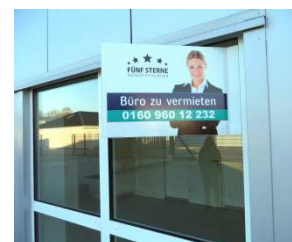
Auch die Immobiliensparte zeigte erste sichtbare Schritte