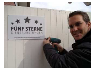
Im Januar 2014 nahm „FSD“ die Geschäftsaktivitäten auf

„In 2015 wollen wir uns daher vor allem auf die im Vorjahr gut performten Segmente konzentrieren.“ Zudem soll das Segment des Online Gutschein- und Ticketverkaufes ausgebaut werden. „Die jüngere Generation verlangt danach, Eintrittskarten usw. online zu erwerben, statt stationär vor Ort zu beziehen“ prognostiziert Erdmann den Trend.